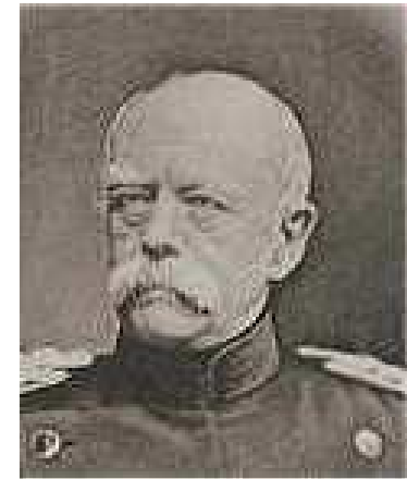
Otto Eduard Leopold von Bismarck-Schönhausen 1815 - 1898

Es stimmt nicht, was der alte Bismarck einst sprach: „In Mecklenburg-Vorpommern passiert alles 100 Jahre später!“