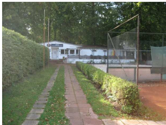
Blick auf das Clubhaus