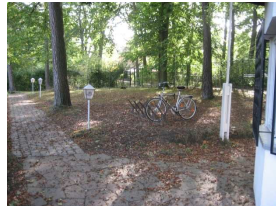
Weg zum Clubhaus